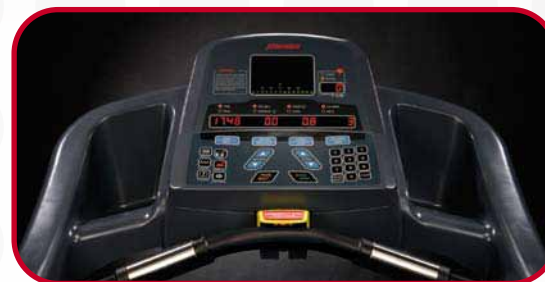
T7000 PRO Console